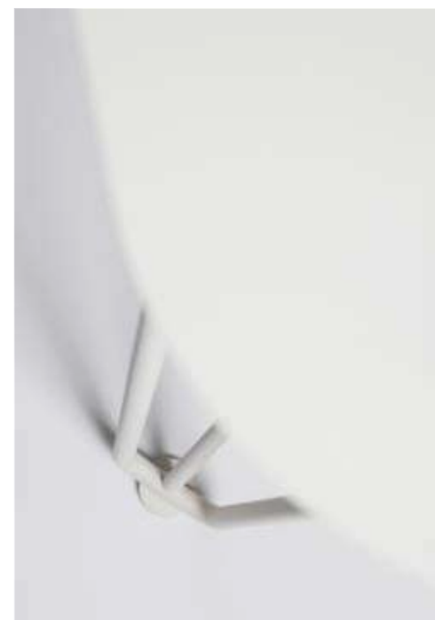
Rambla table Martín Azúa